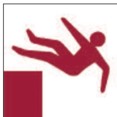
Disgynfeydd peryglus Unprotected drops