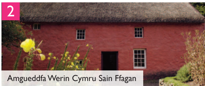
Amgueddfa Werin Cymru Sain Ffagan

Gall ymwelwyr ag Amgueddfa Genedlaethol Caerdydd , sydd wedi'i lleoli yng nghanol dinas hardd Caerdydd, ddarganfod celf, natur ac esblygiad daearegol Cymru. Caiff ymwelwyr fwynhau'r casgliadau celf a gwyddoniaeth trawiadol o Gymru ac o bob cwr o'r byd, gan gynnwys deinosoriaid a'r mamoth blewog. Mae'r casgliadau celf yn cynnwys casgliad byd-enwog yr Argraffiadwyr gyda gweithiau gan Monet, Cézanne, Manet, Renoir, Van Gogh a Rodin, yn ogystal â'r gofod mwyaf yng Nghymru sydd wedi'i neilltuo i arddangos celf modern a chyfoes. Gyda rhaglen brysur o arddangosfeydd a digwyddiadau mawr teithiol a dros dro, mae rhywbeth at ddant pawb yma, waeth beth yw eu diddordeb. Mynediad am ddim.