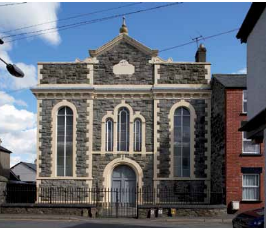
2 Capel yr Annibynwyr