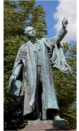
10 T.E. Ellis, Prif Chwip y Rhyddfrydwyr

doedd dim eglwys y plwyf yno; roedd pum plwyf Penllyn yn troi o amgylch y pentrefi cyfagos — Llanycil, Llanfor, Llanuwchllyn, Llandderfel a Llandrillo. Y Pum Plwyf a roddodd un o'i hen enwau Saesneg rhyfeddaf i Lyn Tegid — Pimblemere!