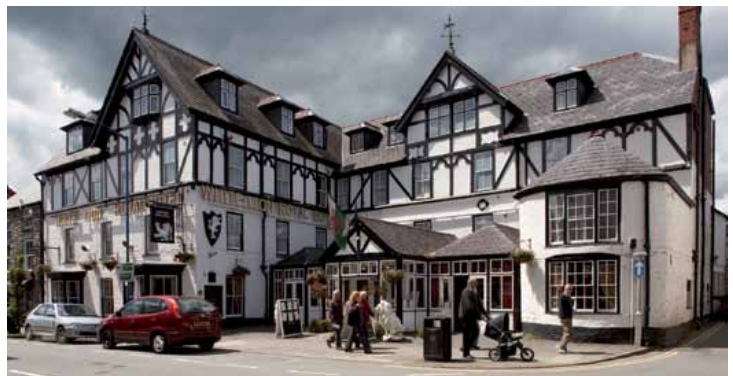
9 Y Llew Gwyn Brenhinol a'i estyniad yn dangos effaith y rheilffordd ar dwristiaeth yr ardal