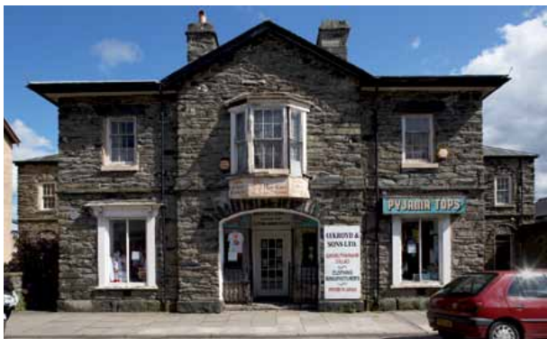
6 Yr hen wyrwys, sydd bellach yn siop ac a fu'n ffatri ddillad nos

Doedd tŷ hwnnw ddim yn ddigon crand, felly daeth i'r Palé a rhoi bendith ei chwstwm i sawl busnes yn Y Bala.