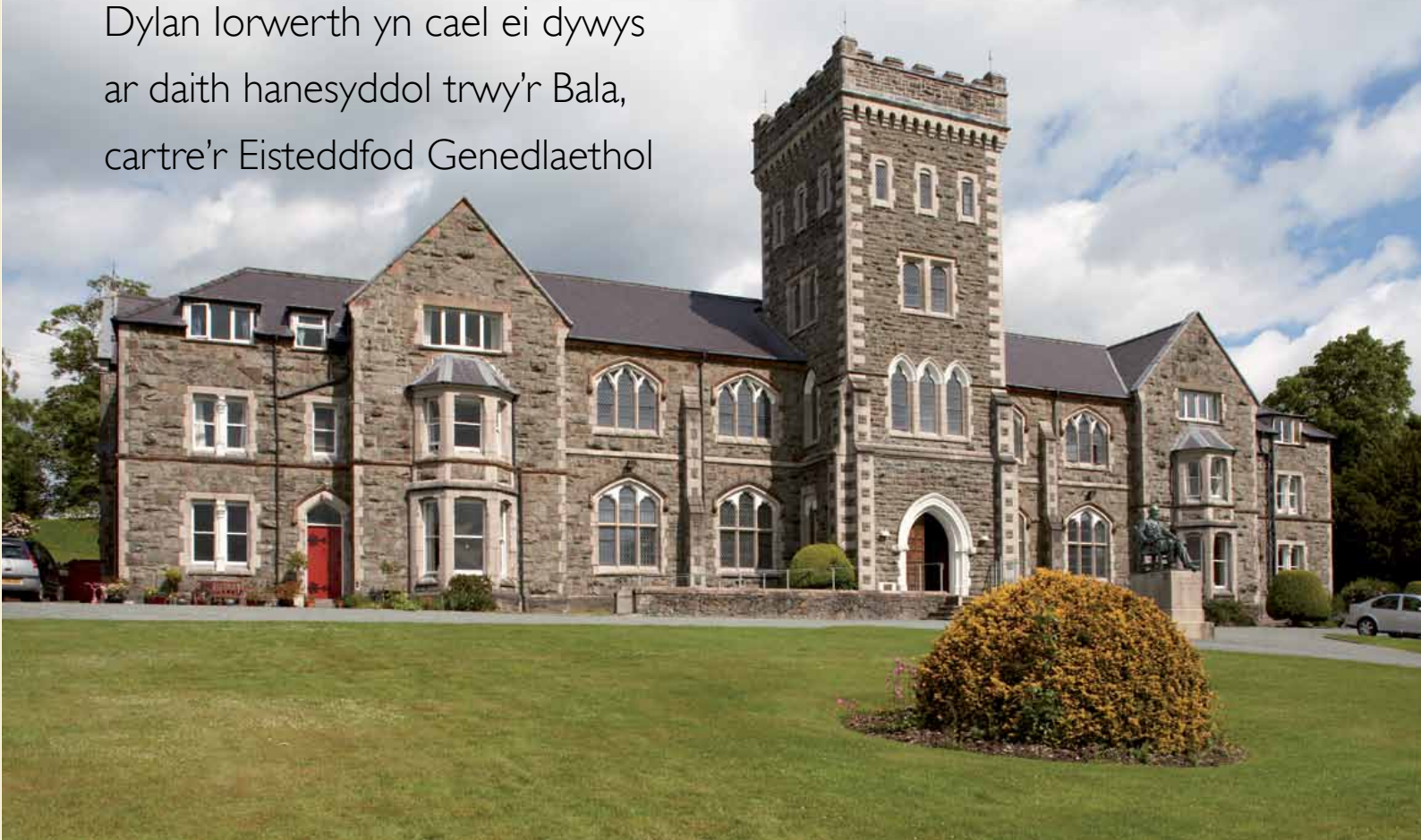
16 Coleg Y Bala, yr academi ddiwinyddol sy'n crisialu'r cysylltiad clos rhwng y dref ac Anghydfurfiaeth

Dylan Iorwerth yn cael ei dywys ar daith hanesyddol trwy'r Bala, cartre'r Eisteddfod Genedlaethol