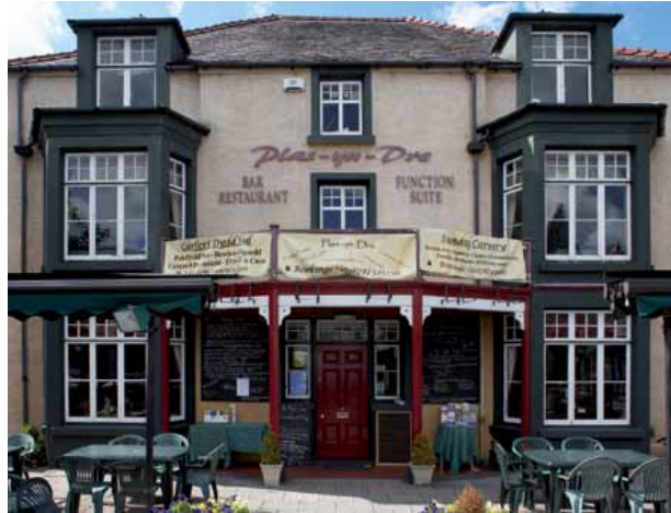
11 Plas yn Dre, a oedd yn dŷ tref i deuluoedd bonedd lleol