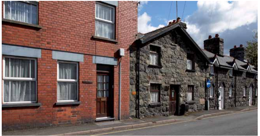
3 Tai yn Stryd y Domen yn dangos y symudiad oddi wrth gerrig lleol at friciau coch yn sgil dyfodiad y rheilffordd yn 1868

ddisgrifiodd dwr o bobl ar lethrau'r domen yn gwau sanau — roedd y dref yn enwog am hynny.'