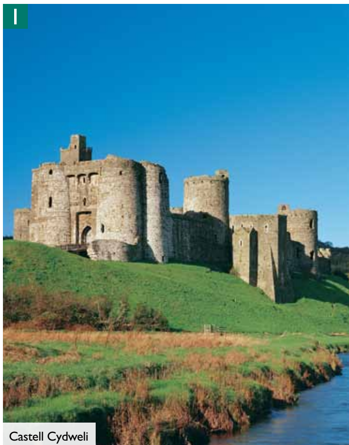
1 Castell Cydweli