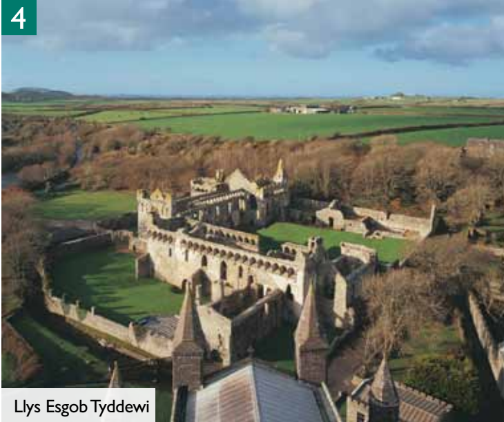
Llys Esgob Tyddewi

Henry de Gower hefyd fu'n gyfrifol am Llys Esgob Tyddewi , sef y llys esgob canoloesol mwyaf trawiadol sydd gan Gymru. Mae'r safle cyfan yn iasol, gan ddwyn i gof gyfnod pan oedd crefydd yn ei hanterth a'r esgobion yn ddynton pwerus. Mae gan y llys addurniadau coeth a cherfiadau cain yn y meini. Mynnwch weld y neuadd fawr; sef siambr fwyaf trawiadol y llys, a oedd yn berffaith ar gyfer gwleddoedd. A chofiwch gymryd cip ar yr isgrofftydd helaeth a'r bwa mawreddog, o fu'n fynedfa addas i adeilad mor eiconig.