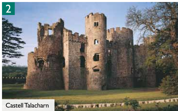
2 Castell Talacharn

Mae Castell Cydweli yn dyst i dechnoleg gwaith maen y gaer ganoloesol. Dyma gastell cadarn a thrawiadol a gafodd ei ddatblygu dros fwy na thair canrif o ryfel rhwng y Cymry a'r Saeson. Mae'r siâp hanner lleuad yn tarddu o gaer stocâd wreiddiol y 12fed ganrif, ac mae'n cael ei amddiffyn gan afon Gwendraeth ar un ochr a chan ffos ddofn ar siâp cilgant ar yr ochr arall. Ym 1136 cafodd y Dywysoges Gwenllïan (gwraig Arglwydd Deheubarth) ei lladd mewn brwydr yn erbyn y Normaniaid a oedd yn meddiannu Cydweli ar y pryd. I fwynhau eiliad gwirioneddol ganoloesol, mynnwch gip ar Gydweli yn niwl y bore.