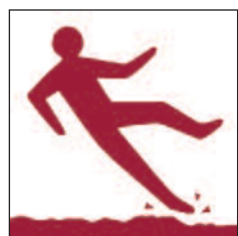
Lloriau anwastad neu lithrig Uneven or slippery surfaces