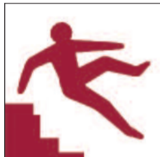
Grisiau anwastad, serth a chul

Ceir rhai o'r arwyddion rhybudd canlynol, neu bob un ohonynt, ar y safle hwn. Some or all of the following warning signs can be found situated around the site.