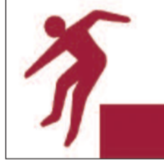
Disgynfeydd peryglus Unprotected drops