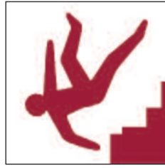
Grisiau anwastad, serth a chul Uneven or steep or narrow stairs

Ceir rhai o'r arwyddion rhybudd canlynol, neu bob un ohonynt, ar y safle hwn. Some or all of the following warning signs can be found situated around the site.