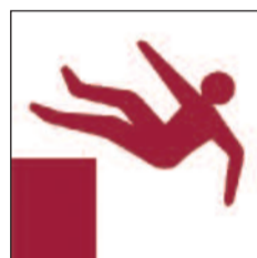
Disgynfeydd peryglus Unprotected drops