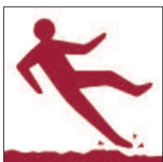
Lloriau anwastad neu lithrig Uneven or slippery surfaces