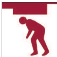
Toeau isel Low headroom