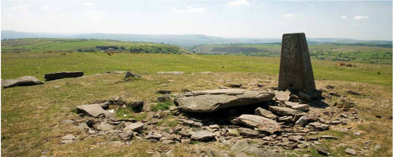
Y wobwr am ddringo at Garn Bugail (4) yw golygfa wych tros y wlad o amgylch

yn wreiddiol yn rhedeg yr holl ffordd o Aberhonddu i Gaerdydd, gan gysylltu'r caerau yn Mhenydarren, Gelligaer a Chaerffili. Mae caer Gelligaer tua 4 milltir (7km) i'r de (ST 134971) a gellir ei chyrraedd drwy ddilyn y ffordd fodern hyd y grib.