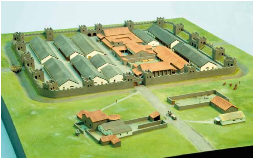
Model o'r gaer Rufeinig yng Ngelligaer fel y gallai fod wedi edrych yn nechrau'r ail ganrif OC