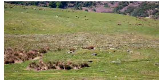
Yn wreiddiol, byddai'r cerrig sy'n gorwedd o amgylch y carn crwn (5) yma wedi bod ar eu traed

Mae'r safle hwn hefyd yn perthyn i'r Oes Efydd Gynnar (2000-1450 cc). I ddechrau, roedd pobl yr Oes Efydd yn claddu eu meirw gydag ychydig offrymau i fynd gyda nhw i'r byd arall — bicer, offer fflint ac, o bosib, dagr