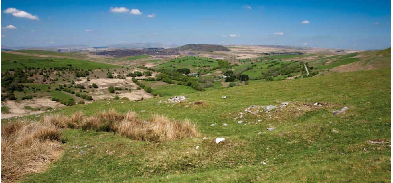
Y mwyaf o'r ddau lwyfan (7) sy'n rhan o hen dreflan o ddiwedd y canol oesoedd o'r enw Dinas Noddfa; dyma safle tŷ gyda waliau o gerrig a thyweirch

byddwch yn cyrraedd ymyl y grib gan edrych i lawr dros flaenau dyffryn bas. Ewch i lawr y llethr at glawdd siâp pedol (5) tua 36 troedfedd (11m) ar draws gyda cherrig mawr yn ymwithio ohono (SO 099034).