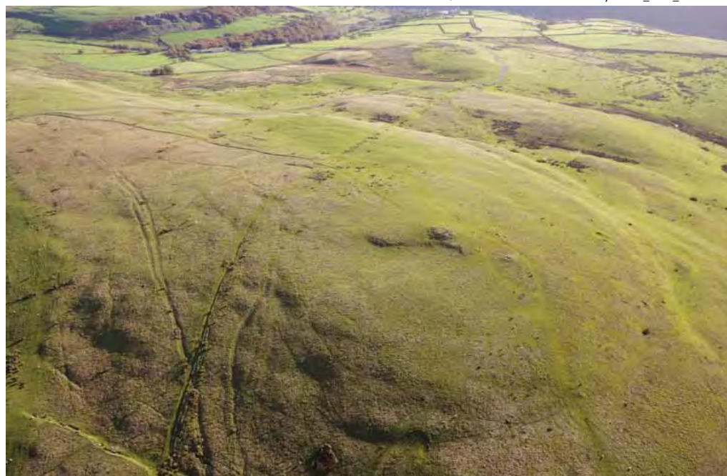
Golwg o'r awyr o Ben Carnbugail o'r gogledd-orllewin — Carn Bugail (4) yw'r twmpath amlwg i'r dde o'r canol

Gwnewch yn siŵr eich bod wedi gwisgo esgidiau cryfion a dillad addas cyn i chi gychwyn ar eich taith. Efallai y byddai cwmpawd yn ddefnyddiol ar gyfer nodi cyfeiriadau cyffredinol wrth gerdded rhwng y safleoedd unigol.