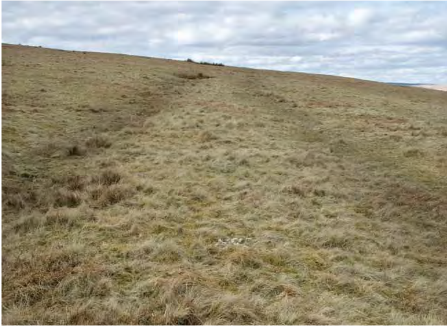
Y ffordd Rufeinig (3) sy'n mynd hyd ochr ddwyreiniol Pen Carnbugail gan gysylltu'r ceiri yng Ngelligaer a Phenydarren; cafodd y ffosydd o boptu eu tywyllu er mwyn eu dangos yn well