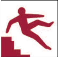
Grisiau anwastad, serth a chul Uneven, steep or narrow stairs

Ceir rhai o'r arwyddion rhybudd canlynol, neu bob un ohonynt, ar y safle hwn. Some or all of the following warning signs can be found situated around the site.