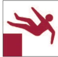
Disgynfeydd peryglus Unprotected drops