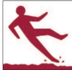
Lloriau anwastad neu lithrig Uneven or slippery surfaces