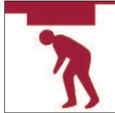
Toeau isel Low headroom