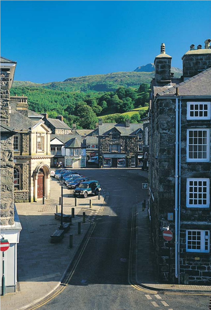
Tref farchnad fach Gymreig yw Dolgellau ac yma y mae'r casgliad mwyaf yng Nghymru o adeiladau rhestredig (wedi'u lleoli) mewn un dref. Rhoddwyd cydnabyddiaeth bellach i arwyddocâd treftadaeth bensaernïol a hanesyddol Dolgellau gan status ardal gadwraeth.