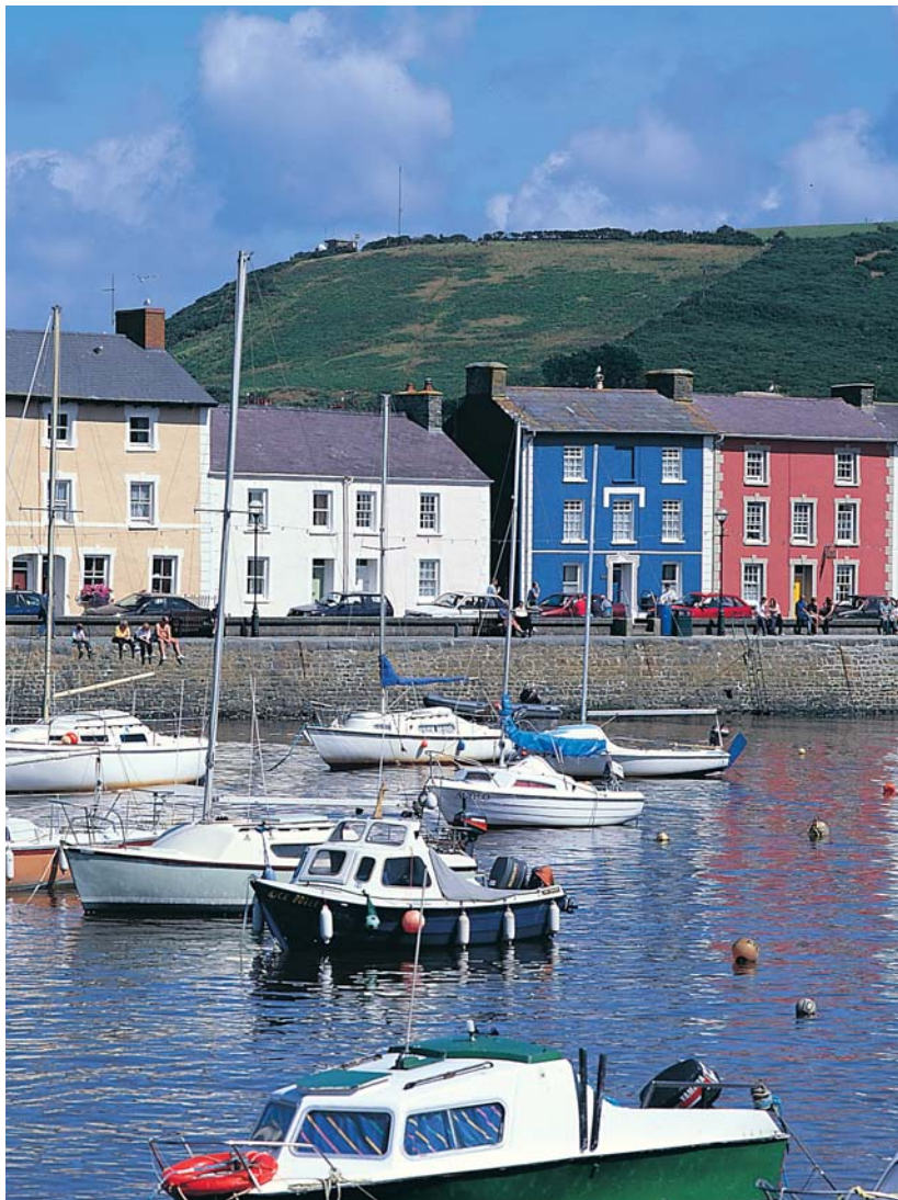
Mae tref Aberaeron yn adnabyddus am ei thai lliwgar sydd wedi'u lleoli o amgylch yr harbwr. Dynodwyd y dref yn ardal gadwraeth er mwyn osgoi unrhyw ddatblygiadau anghydnaws.