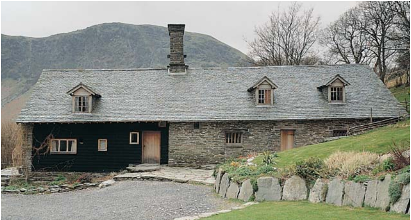
Cafodd ffermdy Nannerth Ganol, Rhaeadr Gwy, oedd unwaith yn adfail ei adfer yn adeilad y gellid byw ynddo unwaith eto.