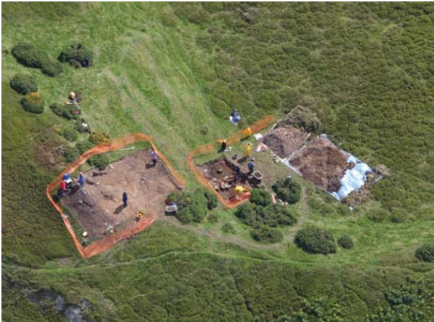
Golwg o'r awyr ar y gwaith cloddio ar ran o'r gwrthglawdd ym Moel y Gaer, Llanbedr

mwyn gwarchod yr hyn sy'n weddill, cafodd ei gorchuddio trwy ail-greu beddrod, sydd, gobeithio, yn gwarchod a dehongli'r safle.