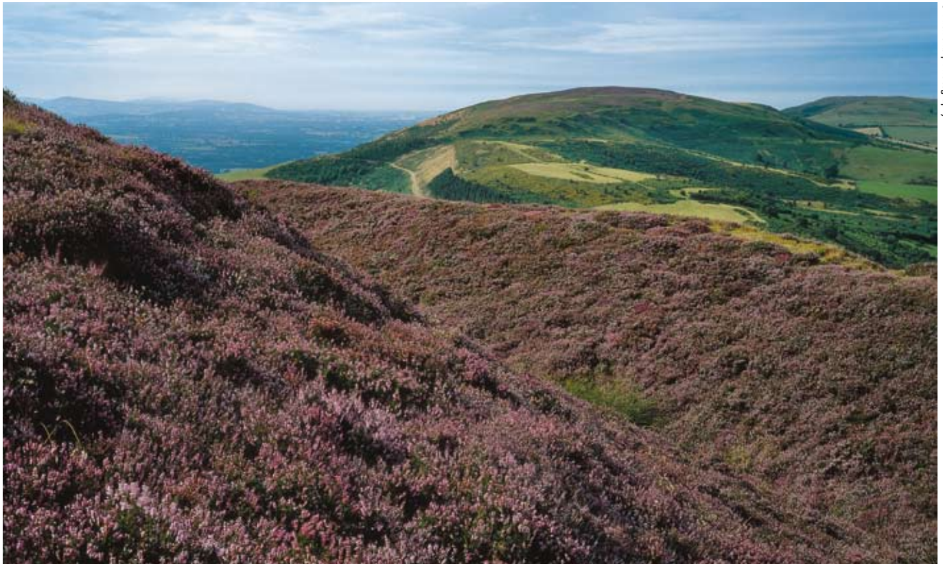
Cloddiau amddiffynnol grugog bryngaer Moel Arthur gyda Phenycloddiau yn y pellter

Mae golygfa wych o gopa Penycloddiau, un o Fryniau Clwyd, yng ngogledd Cymru. O'ch amgylch mae cloddiau amddiffynnol un o'r bryngaerau mwyaf o Oes yr Haearn yng Nghymru. Tua'r gorllewin, mae'r ddaear yn cwmpo'n gyflym i feysydd ffwythlon Dyffryn Clwyd gyda thref Dinbych yn glir 5 milltir (3 km) i ffwrdd. Yn y cyfeiriad arall, mae Sir y Fflint ac aber afon Dyfrdwy. Tua'r gogledd-orllewin, mae'r bryniau'n tonni'n ysgafn i lawr tuag at Brestatyn a Môr Iwerddon tu hwnt. Tua'r de-ddwyrain, mae'r rhes bryniau'n codi i'w man uchaf ym Moel Famau (1,818 troedfedd/554m) — gyda Thŵr y Jiwbilf o'r ddeunawfed ganrif ar ei brig — cyn syrthio i geunant Bwlch Nant y Garth sy'n gwahanu Bryniau Clwyd oddi wrth Fynyddoedd Llantysilio tua'r de.