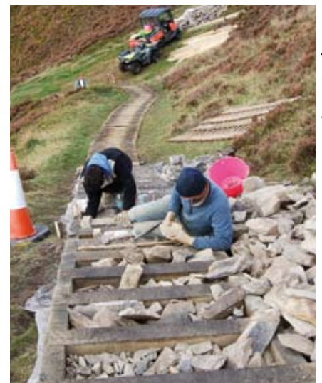
Adeiladu un o'r rampiau i arbed llethrau Moel Fenlli

Gwnaed gwaith mawr i drwsio effaith erydu ar Foel Arthur a Moel Enlli ym Mryniau Clwyd tra bod gwaith wedi'i wneud ar y llwybr at Gaer Drewyn, ym mhen y de-orllewin o Fynyddoedd Llantysilio ger Corwen. Roedd traed pobl a defaid wedi cael