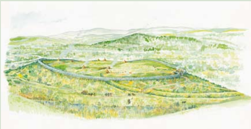
Argraff arlunydd o Gaer Drewyn yn Oes yr Haeam

h. Denbighshire County Council. Illustration by Tim Morgan