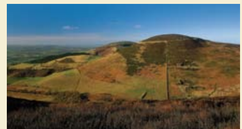
Moel Arthur o'r de-ddwyrain

Cafwyd tystiolaeth o Oes yr Efydd hefyd ym Moel Arthur. Mae'n bosib bod cam y cerddwyr yn y canol yn gorwedd ar feddrod. Yn 1962, daeth casgliad o dair bwyell gopr o Oes yr Efydd i'r golwg ar ôl glaw trwm.