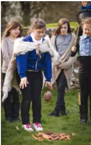
Offrwm i gyndeidiau — un o ddigwyddiadau Creu a Chracio

Nid diwedd y cloddio oedd diwedd y prosiect. Yng ngwanwyn 2012, gweithiodd