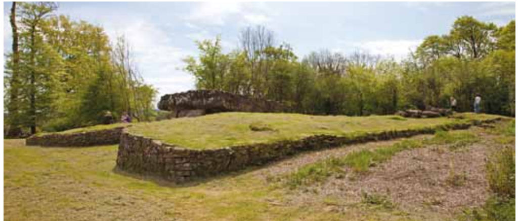
Mae modd gwerthfawrogi maint yr heneb yn Nhinkinswood ar ôl clirio'r llystyfiant

Bu'r grŵp yn ffensio'r ardal gyfagos, sy'n cael ei galw yn 'Chwarel', er mwyn ei hagor i ymwelwyr am y tro cyntaf. Ers tro byd awgrymwyd mai oddi yma y daeth y capfaen anferth 40 tunnell yn Nhinkinswood — un o'r mwyaf yng ngwledydd Prydain. Roedd yno hefyd ddau bentwr dengar o gerrig gerllaw a allai fod yn siambrau claddu chwâl. Felly, roedd y safleoedd hyn, ynghyd â'r beddrod yn