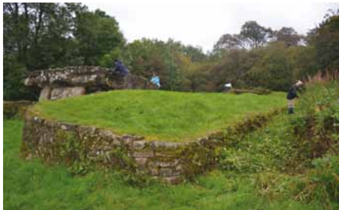
Gwirfoddolwyr o Ymddiriedolaeth Brydeinig Gwirfoddolwyr Cadwraeth yn dofi'r llystyfiant ymwithiol yn Nhinkinswood

Yn Nhinkinswood, roedd y prosiect yn adeiladu ar ymchwiliadau arloesol John Ward, ceidwad archeoleg Amgueddfa Genedlaethol Cymru yn 1914. Dangosodd Ward bod carnedd led betryal, gyda muriau cynnal o gerrig sych, yn amgylchynu'r siambr – heblaw am yr ochr ddwyreiniol lle'r oedd y muriau'n crymu i greu buarth o flaen mynedfa'r beddrod. Mae'r rhain i gyd yn elfennau nodweddiadol o feddrodau 'Cotswold-Hafren'. Daethpwyd o hyd i fwy na 900 darn o asgwrn dynol, a'r rheiny efallai'n dod o hyd at 50 o