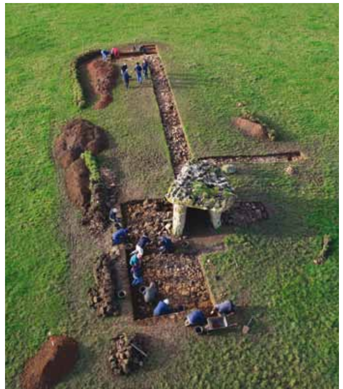
Y cloddio ar waith yn Llwyneliddon

• Er fod prosiect Arheoleg Cymunedol Tinkinswood wedi gorffen, gallwch ymweld â'r wefan o hyd — http://tinkinswoodarchaeology.wordpress.com/ — i ddysgu rhagor am y prosiect a darllen blogiau'r cloddio.