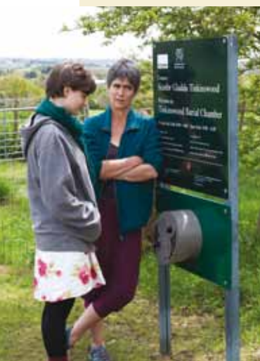
Ymwelwyr yn mwynhau'r postyn gwrando newydd yn Nhinkinswood

dilyn y lôn am i lawr am tua 150m (165 llath) at gamfa ar y chwith. Croeswch y gamfa a dilyn y llwybr trwy glwstwr o goed a thrwy sawl cae i gyrraedd trac sy'n dringo i fyny o ddyffryn Elái. Trowch i'r chwith a dilyn y trac yn ôl i Sain Niclas.