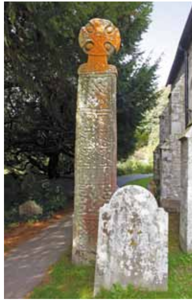
Croes Nanhyfer (c) yw un o henebion mwyaf trawiadol Cristnogaeth gymnar Cymru