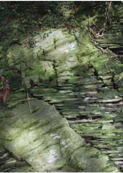
Mae Croes y Pererinion (b) yn cael ei chysylltu gyda phererindodau i Dyddewi