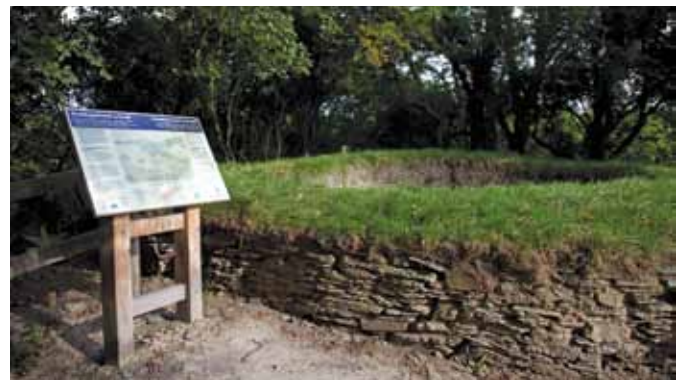
Y tŵr crwn ar y mwnt yng Nghastell Nanhyfer (a) gydag un o'r paneli dehongli newydd sy'n ddangos ffrwyth darganfyddiadau archeolegol diweddar

Nanhyfer, un o henebion Cristnogol gorau a chynharaf Cymru. Mae'r addurn sydd arni a'r ffordd y cafodd ei gwneud yn debyg iawn i Groes Caeriw (y seiliwyd logo Cadw arni), ac mae'n ddigon posib fod y ddwy wedi'u gwneud gan yr un person. Y farn gyffredin yw eu bod yn deillio o ddechrau'r unfed ganrif