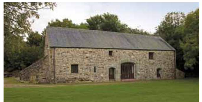
Yr hen ysgubor yn Fferm Pentre Ifan (dd) yw'r cyfan sy'n weddil o hen blasty Tuduraidd y teulu Bowen

Wrth i chi ddod at ddiwedd eich taith, cyn i chi groesi'r afon a dringo'n ôl i Gastell Nanhyfer, cofiwch edrych ar y bont (f) yn enwedig ei hadeiladwaith. Mae'n deillio o ddiwedd y ddeunawfed ganrif neu ddechrau'r bedwaredd ganrif ar bymtheg. ✚