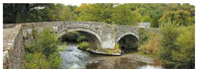
Y bont yn Nanhyfer (e)

Ar ôl pasio tafarn y Trewern Arms, croeswch y bont dros yr afon (f), trowch i'r chwith a dringwch at y castell.