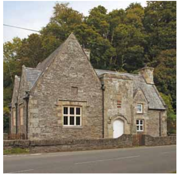
Mae'r Coleg (ch) yn Felindre Farchog yn cynnwys rhannau o ysgol o ddechrau'r ail ganrif ar bymtheg

ar ddeg, ond awgrymwyd mewn gwaith academiaidd diweddar eu bod hyd yn oed yn hŷn na hynny ac yn deillio mewn gwirionedd o ddiwedd y ddegfed ganrif.