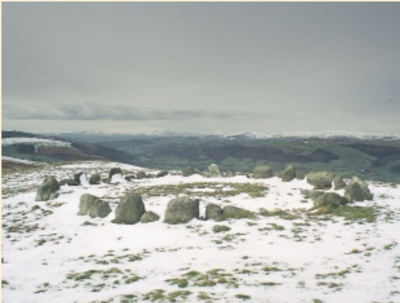
Mae'r cylch ymylfaen o'r Oes Efydd yn Moel Tŷ Uchaf, Llandrillo, Sir Ddinbych, yn enghraifft wych o'r safleoedd cynhanesyddol niferus a gaiff eu cynnwys ar y Gofrestr.

Yr Adran Gynllunio, Canolfan Ymgynghori Busnes, Ystad Ddiwydiannol Rassau, Glynabwy NP3 6XB (01495) 350555