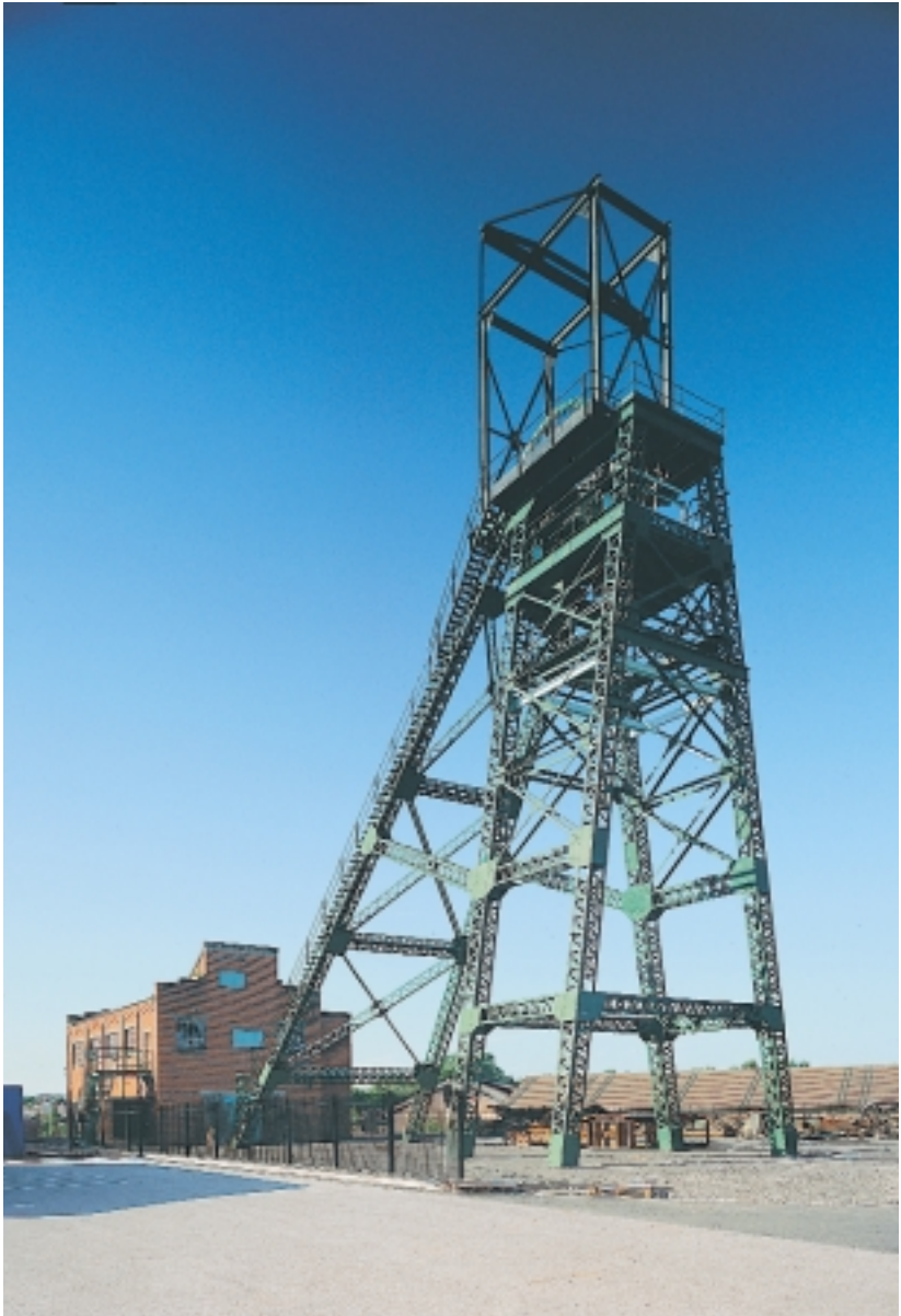
Ymysg yr henebion diwydiannol ar y gofrestr ceir olwynion codi Rhif 2 yng Nglofa Bersham ger Wrecsam. Cadwyd hwn yn ei gyfanrwydd gyda chymorth grant henebion.