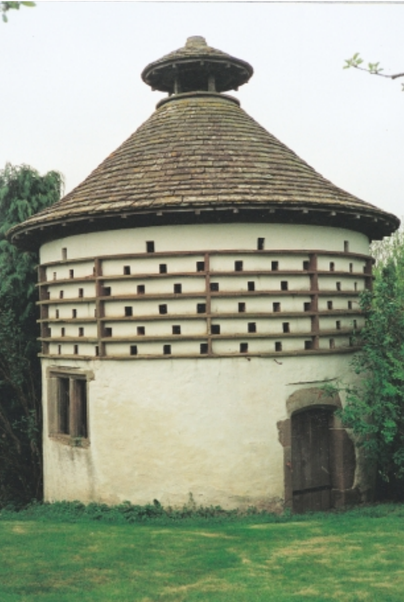
Mae'r colomendy hwn yn Sir Fynwy yn un o'r henebion cofrestredig mwyaf anarferol.